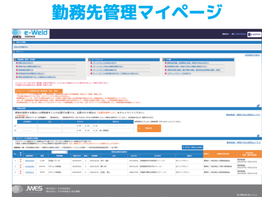
勤務先管理マイページ